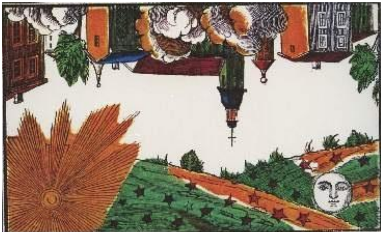
Les maisons éclairent le soleil et la lune

ANAGNI – PALAZZO COMUNALE – SALA DELLA RAGIONE