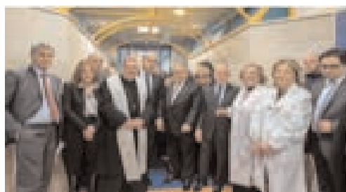
inaugurazione reparto febbraio 2014